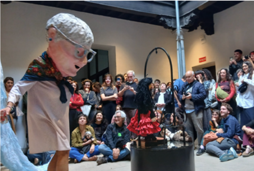
Distintos momentos de la constitución del Concejo de la Universidad Popular del Mediodía el 5 de mayo de 2026 en Casa de Porras.