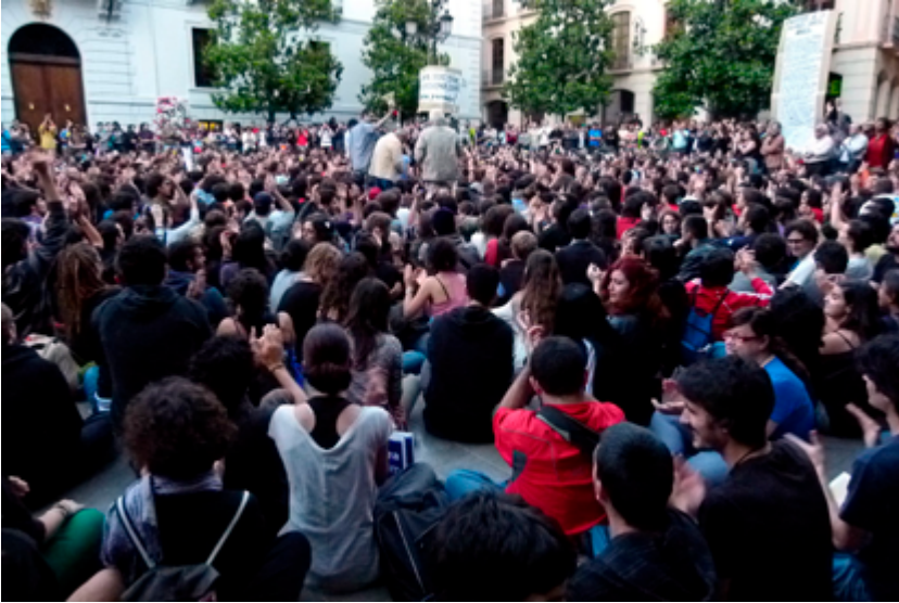
Asamblea 15M Granada de la Plaza del Carmen de Granada.