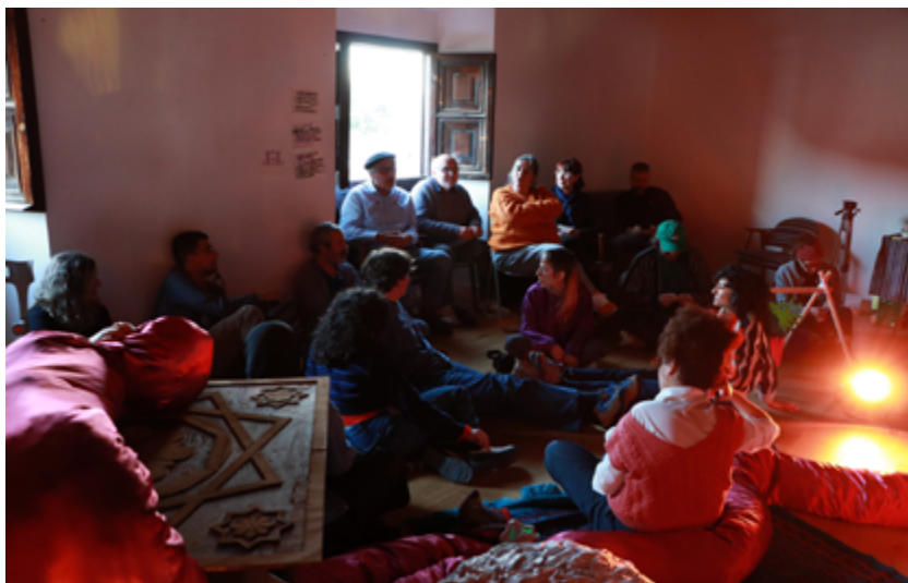
Encuentro de colaboradores del proyecto. Sala de los Espejos de Casa de Porras. 12 marzo 2026.