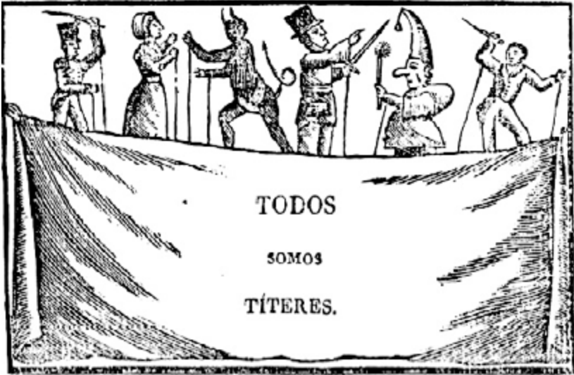
Xilografía de la Imprenta Estivill, Barcelona, 1850