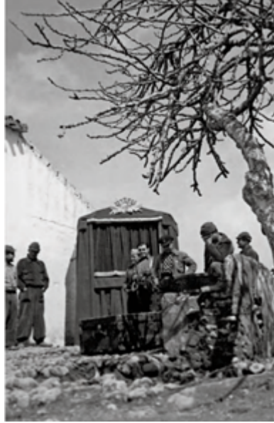
Titeres de La Tarumba, probablemente en la Sierra de Guadarrama, en 1837. Fondos del Teatro Obraztsov de Moscú