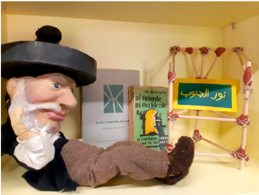
Chorrojumo en la vitrina de la Biblioteca Popular Federico García Lorca de la Casa de Porras.

Un viejo sueño que nos ha rondado todo este tiempo: un teatrillo de cachiporra para Casa de Porras. Hubo algunas tentativas. Primero llegó a la casa el muñeco Chorrojumo, construido en cartón piedra y técnicas tradicionales por la artesana Isa Soto para Lo vivo · Lo pueblo · Lo jondo. Geopsiquias del Albaicín de Operaciones Cunctatio. Después de su incursión performativa en abril de 2023, cuando fue cuerpo mediúmnico en el Ensamblaje Demosófico del Albaicín , desde entonces Chorrojumo ha dormido en una de las vitrinas de la Biblioteca Popular Federico García Lorca de la Casa de Porras, esperando acaso la llegada de nuevos compañeros.