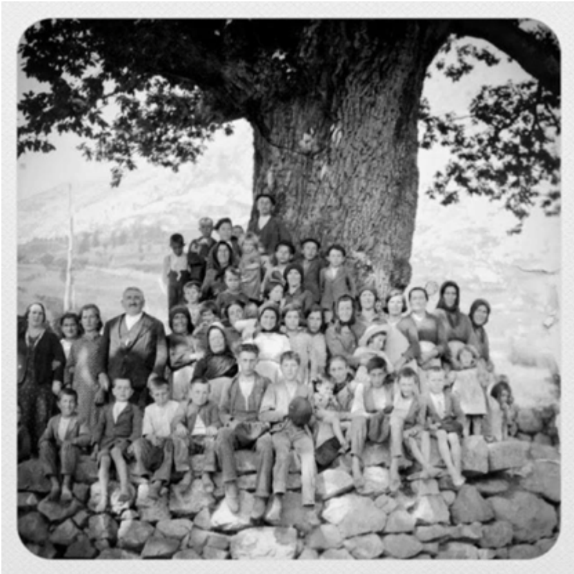
Desaparecido Roble de Bermiego, parroquia del concejo asturiano de Quirós. s.f.s.a.