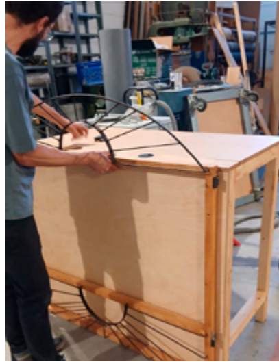
Taller de José Luis Conde Pipo, construyendo el teatrillo.