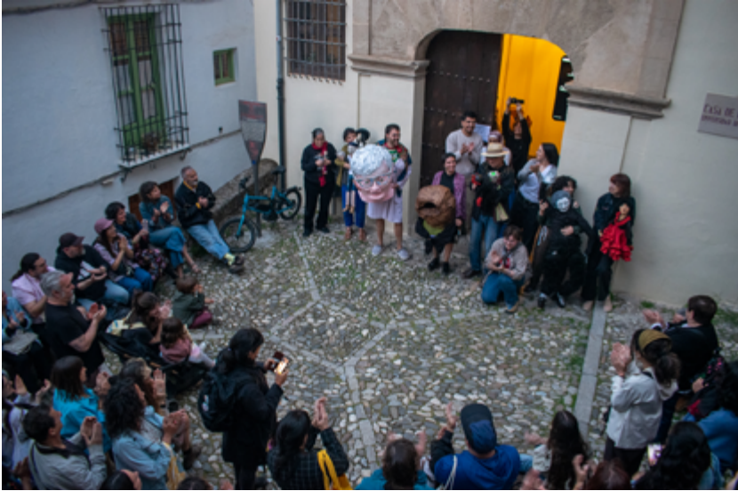
Final en Placeta de Porras de la constitución del Concejo de la Universidad Popular del Mediodía.