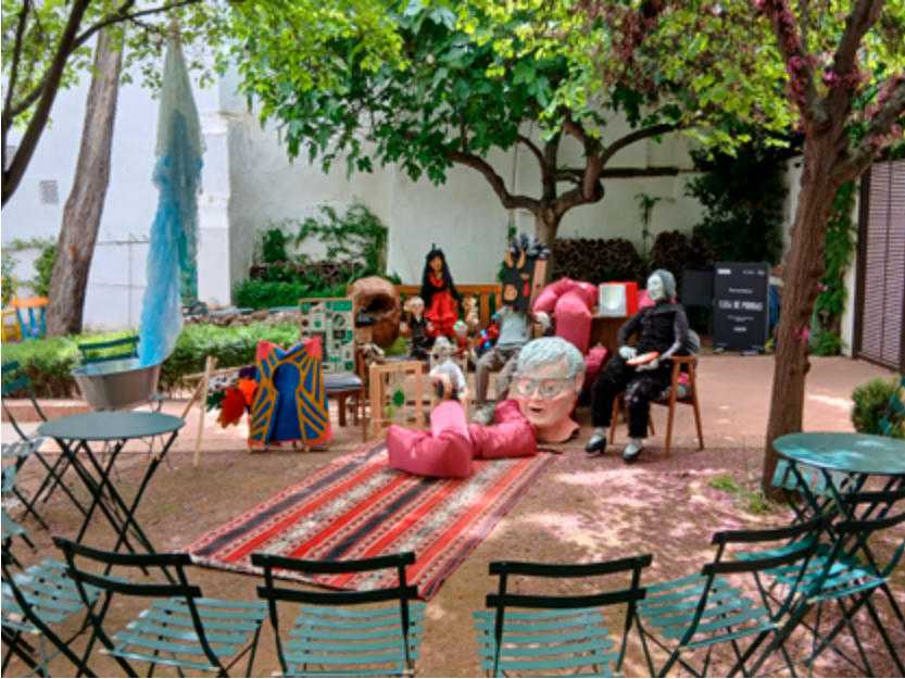
Primera visita al jardín de la Asamblea de títeres y muñecos de la Universidad Popular del Mediodía para la grabación de las canciones para Despertar y Dormir a los muñecos de Gazpacho de Grelos y Pablo Und Destruktion

espacio público y entregar los medios de producción que tenga disponibles. También defenderlo cuando la inercia neoliberal y antisocial de las políticas universitarias amenace estos espacios de encuentro. Porque a pesar de que no hay ningún proceso asambleario central responsable de la gobernanza de la Casa de Porras, se dan las condiciones para que experiencias de autonomía y autoorganización puedan darse y tener lugar en ella. Quien pasa por la casa y ha propuesto un juego, ha experimentado la capacidad de escucha. Defendemos además que esto esté teniendo lugar en la Universidad. Frente a la universidad neoliberal y sus dinámicas productivistas y empresariales defendemos el derecho de lo público a ser otra cosa .