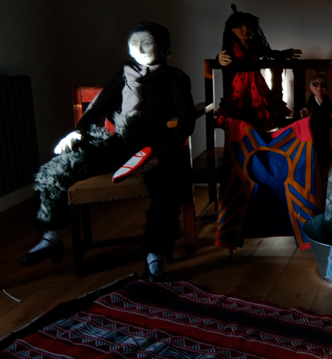
Concejo de la Universidad Popular del Mediodía en la Sala de los Espejos de Casa de Porras, 18 abril 2026.