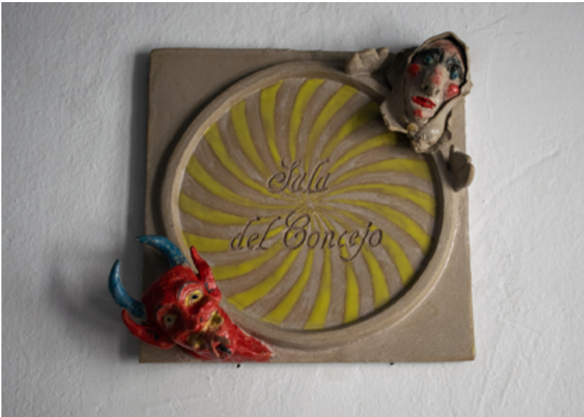
Sala del Concejo. Casa de Porras.

El baldosín de cerámica de la Sala del Concejo , como el resto de los de la casa, es un trabajo de Maya Vergel y Fernando G. Méndez.