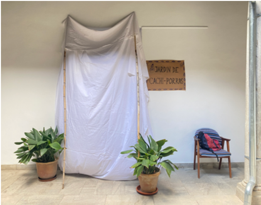
Especulación de Susana Velasco y los participantes del taller Vernacular. Un deseo de habitar en el acceso al jardín desde el patio de Casa de Porras. Marzo 2024

El sueño permaneció latente hasta que interceptamos un poco de dinero para abordarlo en toda su complejidad. No se trataba únicamente de dotar de un teatrillo de títeres a la Casa de Porras, lo importante era iniciar