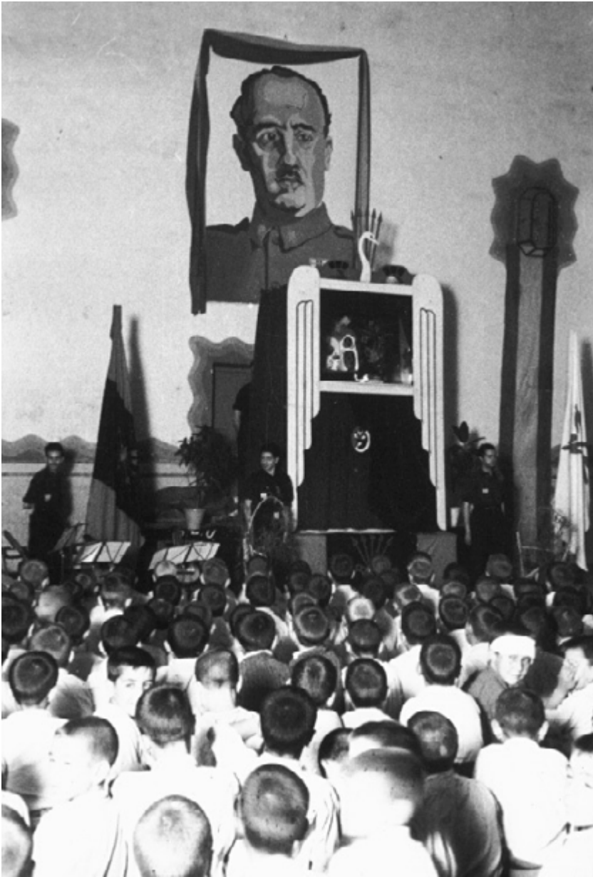
Guignol en el Sindicato Español Universitario de Falange en el Hospicio Antiguo de Madrid ca. 1940 - 1943. Noviembre de 1942.