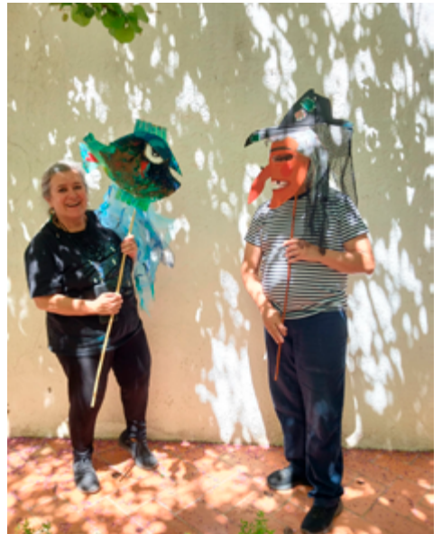
Fotos del Taller de Martinicos. 18 abril 2026. Casa de Porras.