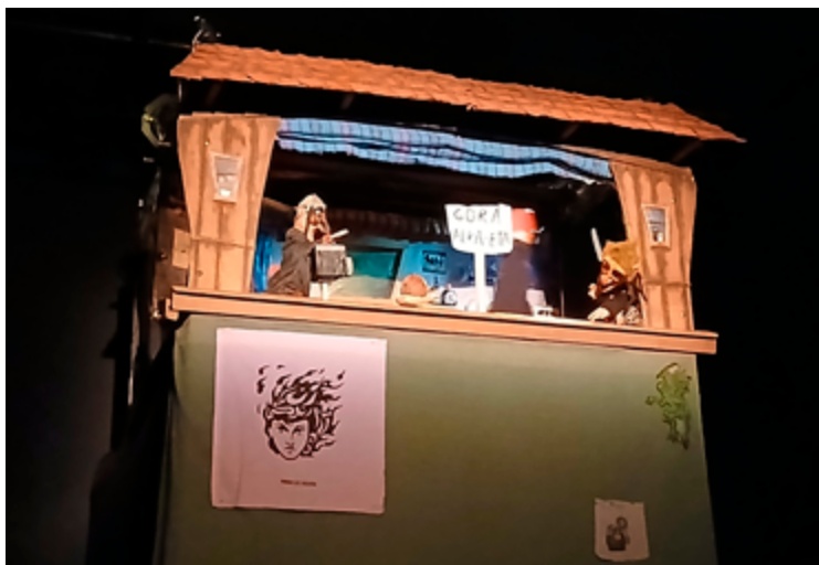
Obrador de Títeres Algarabía, Granada. Abril 2026

La Bruja y Don Cristóbal , Títeres desde abajo. El Apeadero, Granada 2026.