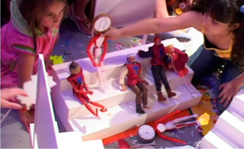
Asamblea final de muñecos del El Ente Transparente . C.A.S.I.T.A. + Luddotek, junio del 2008

harían la experiencia material, artística, de la explotación por el capital, del trabajo postfordista, pero también de la liberación del tiempo productivo. Al final de esta acción, bellamente cuidada en la producción como todos los proyectos de C.A.S.I.T.A., tenía lugar una pequeña asamblea con muñecos en un espacio idéntico en el que había sucedido el juego, creando un distanciamiento lúdico que favorecía la conversación con los niños sobre lo sucedido. Un antecedente infantil de este concejo de muñecos que repercute sobre una conversación institucional mayor, más compleja, pero tan lúdica en su corazón como aquella.