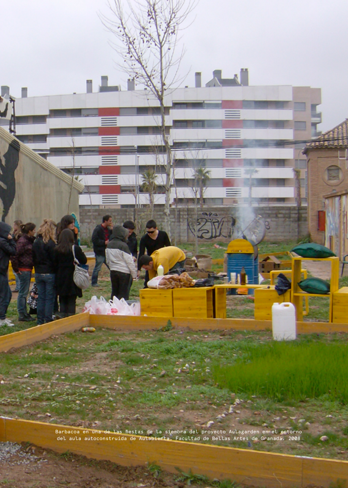
Barbacoa en una de las fiestas de la siembra del proyecto Aulagarden en el entorno del aula autoconstruida de Aulabierta. Facultad de Bellas Artes de Granada. 2008