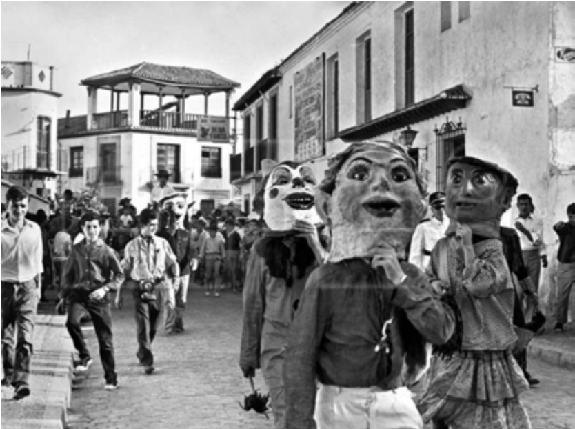
Gigantes y cabezudos recorren el barrio granadino del Albayzín con motivo de las fiestas en honor de su Santo Patrón, San Miguel. Ca. 1960.

Muñeco y máquina : objetologías populares y a la vez figuras cargadas de criticidad. Una nos trajo algo de progreso y mucho de alienación. El otro fue desterrado al país de los niños pese a que nos permite decir lo que a menudo callamos. Una siniestra simbiosis de muñeco y máquina sobrevuela el cielo plomizo de nuestra época, drones, bots impredecibles, androides que triplican nuestra fuerza, pero también nuestra indiferencia a los desafíos del presente.