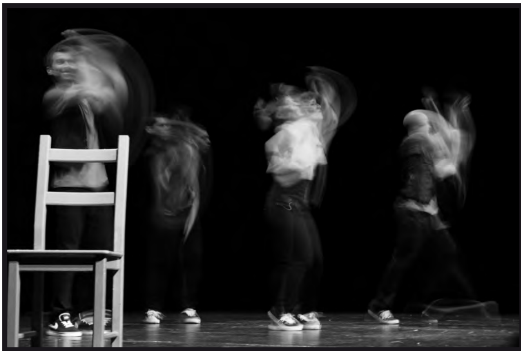
Gara Petra Ramos Bejarano Kulbik (Mueve tus sentidos). Centro Cívico del Zaidín