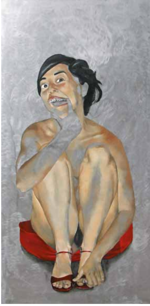
Pintura: Gelsen Ortín Riquelme “Sin título”